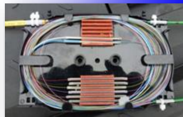
umístění optické kazety

Získáte plně funkční, malé a praktické připojovací místo nejen pro energetické odběry. Řešení může také nést zákaznickou rozvodnici s vaší individuální výbavou. V době bez odběrů je sloupek ukryt v zemi a je tak chráněn proti poškození a vandalizmu. Konzultace a návrhy poskytujeme zdarma a zajišťujeme k výrobku také záruční i pozáruční servis.