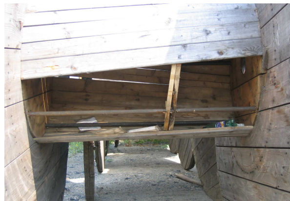
zlomená nebo chybějící prkna 3-6 ks 30%