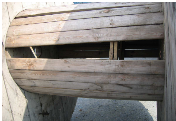
zlomená nebo chybějící prkna 1-2 ks 15%