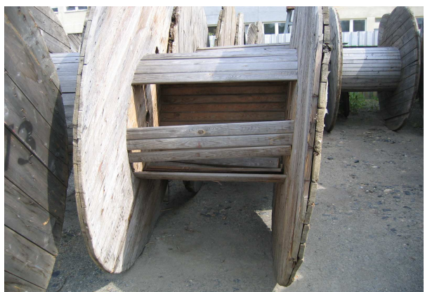
zlomená nebo chybějící prkna až polovina obvodu středu 7ks 60%